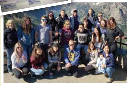
留学直後に行ったイエローストーン国立公園でのキャンプ時の写真