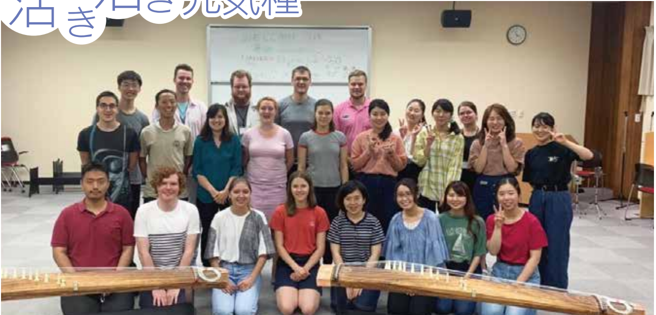
写真:ワールドキャンパスの学生との交流