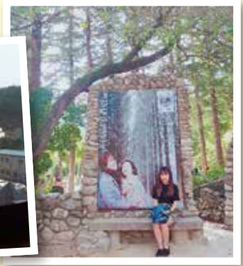
留学中に訪問した「冬ソナ」のロケ地南怡島(ナミソン)