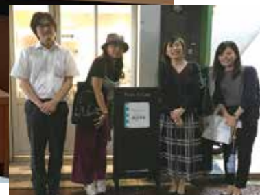
講演の行われた「本のあるところajiro」にて