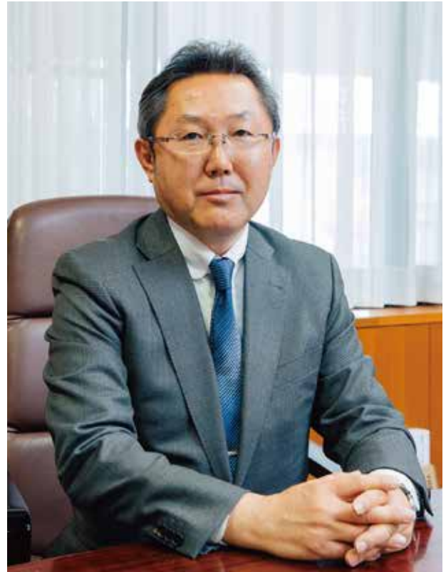
熊本県立大学学長

つまり、私憤の罣は、人間が不完全な生き物である限り、許されるべき感情である。要は、知識人を自認するのであれば、私憤はそのまま育てず、冷静な理性にくるんでは言葉の創造力を駆使してどれだけ美しく語るか、である。それが知識人の証しというものだろう。