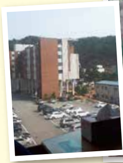
寮からキャンパスまでは歩いて1分!