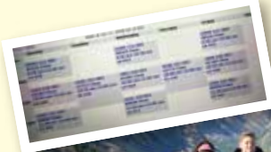
履修していた時の時間割

寮費$2,500と食費$1,700(1セメスター)、航空券約27万円 学費は交換留学のため新たには発生せず。 日本学生支援機構と県立大学の奨学金を利用