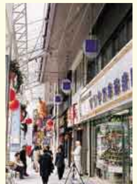
アーケード内の温熱環境についての調査の様子(2001年1月、長崎市にて。中央の三脚に様々な測定用センサーを設置。天井から吊り下げたロープに温度センサーを取付。)

「環境への負荷が少なく、かつ快適な居住環境、特に都市環境を創り出すことが、私の研究の目標です。その一環としてこれまで商店街で見られるアーケードに注目して研究を進めてきました。