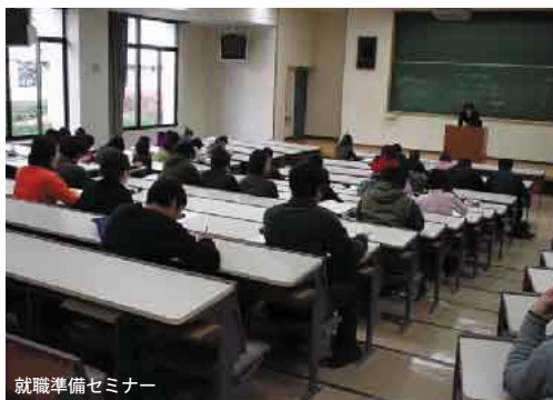
就職準備セミナー