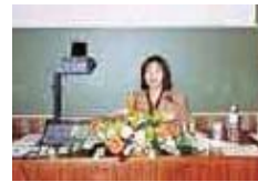
ギリシャの理論・応用言語学会にて

一九九九年十月から一年間、ダラム大学言語学科客員研究員として私が滞在したダラムは、十一世紀ノルマン様式の大聖堂が川縁にそびえ立つ、イングランド北部の田舎町です。イギリスの冬は半年間も続くので、春を告げる黄色いラッパ水仙が、目にも心にも鮮やかでした。