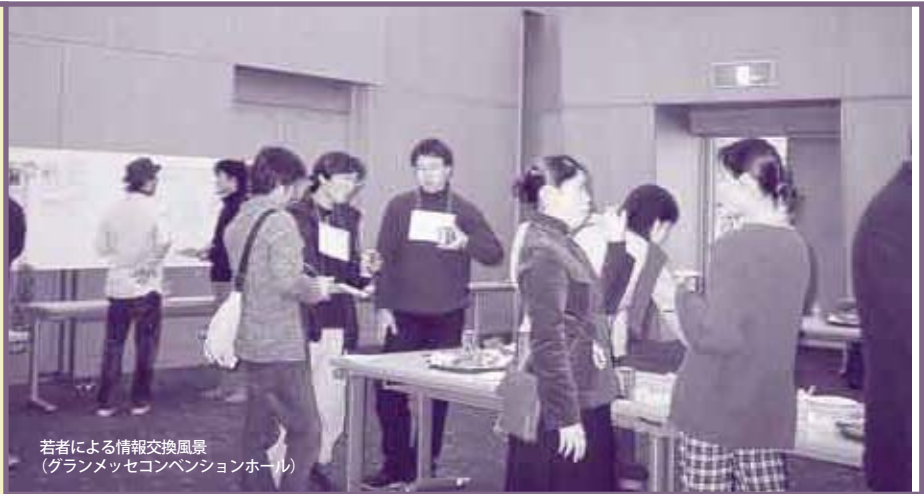
若者による情報交換風景 (グランメッセコンベンションホール)

結局、大学生時代に何をやるか、何を学ぶか(学べるか)は、自分自身が決めることである。