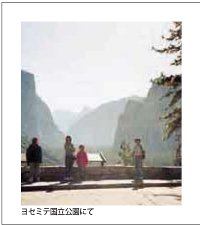
ヨセミテ国立公園にて

常識。常識は、行動の過程で変化する情報の海から、何かをすくいとる網の役目を担う、身体に根ざした知識のように思える。きつと日本の校舎についての常識が、あの時の私たちの目の探知能力を掌握していたのだろう。見えないものを見るには、常識の網の変形が必要だ。が、私の網はたいへんに堅牢で、一年ぐらいでさほど変形したとも思えない。異なる風景や慣習に数多く出あった気では、それも結局は、私のそれまでの「見え」のカテゴリーを逸脱するものではなかったのかもしれない。弾性に欠けた私の網からすると逃げた不可視の何か。ほんとうは君らにこそあつてみたかった。