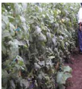
ナスの野生種をトマトの台木に使った接ぎ木トマト栽培(根元はナス野生種、地上はトマト、熊本県清和村の篤農家での実証試験)

「ナスにトマトを乗らせる」とは、正確には土壌伝染性の病気や害虫に強いナスの野生種を台木(根元)に用いた接ぎ木トマト栽培の研究です。毎年、同じ畑でトマトを栽培すると土壌中に病気や害虫が蔓延してトマトは生育できなくなります。これを連作障害と言います。その対策として、農薬を使った土壌消毒が普及していますが、環境や人体への影響が心配されるために農薬の使用は最小限度にとどめるべきです。一方、土壌の病気や害虫に強い植物を台木に利用する接ぎ木栽培は環境に優しい栽培技術です。本研究は熊本県農業研究センター―農産園芸研究所野菜部と協力し、土壌の病害虫に強いトマト用台木植物の育成、ナス野生種の病害抵抗性の機構解明を行っています。トマトは熊本県の特産野菜であり、生産量は全国一です。全国有数の農業県であり環境立県である熊本では、人や環境に優しい農業技術の開発と普及は益々重要になります。