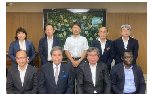
水銀研究留学生の受入れ