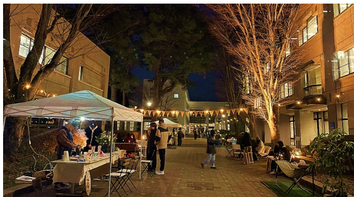
コミュニティづくり「県大マルシェ」