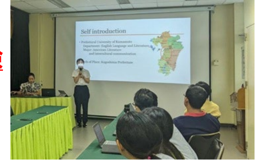
カンボジアでのインターンシップ