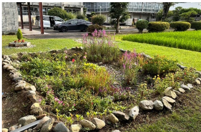
県立南稜高校に整備した雨庭