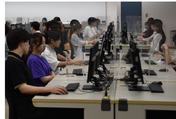
情報実習室での授業風景