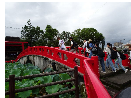
青井阿蘇神社周辺散策

県や包括協定市町村と連携し、 地域の課題解決や地域活性化等につなげる契機となる取組 を実施