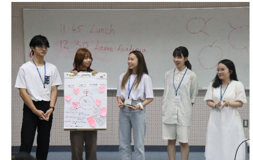
カセサート大学からの受入れ