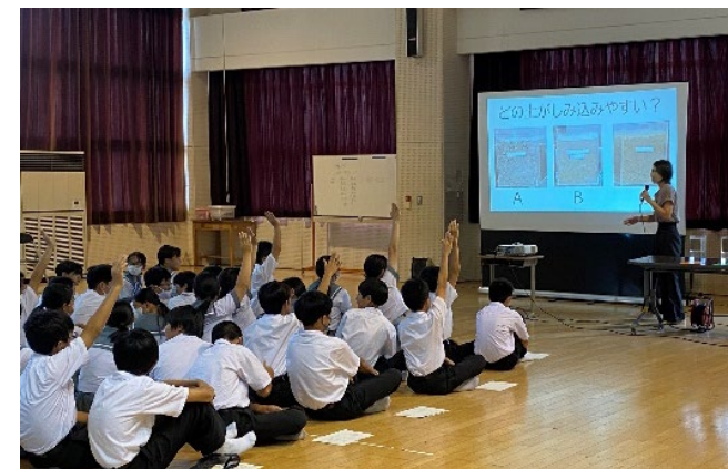
中学生を対象とした勉強会（R5.8）