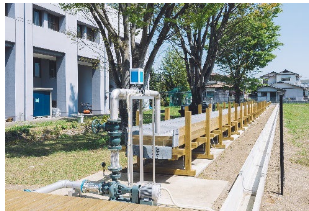
県立大学内に整備した国内最大級の実験水路